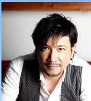
●別所哲也さん 国際短編映画祭代表 俳優