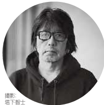
森達也さん 作家、映画監督、 明治大学特任教授